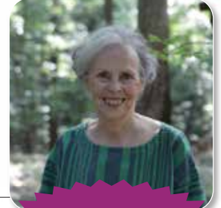
Ebe İna May GASKIN ile Kurs Programı

13.30 - 16.30 Ebe İna May GASKIN ile Kurs Programı (2. Bölüm) / Doğum Distosilerine Yaklaşım